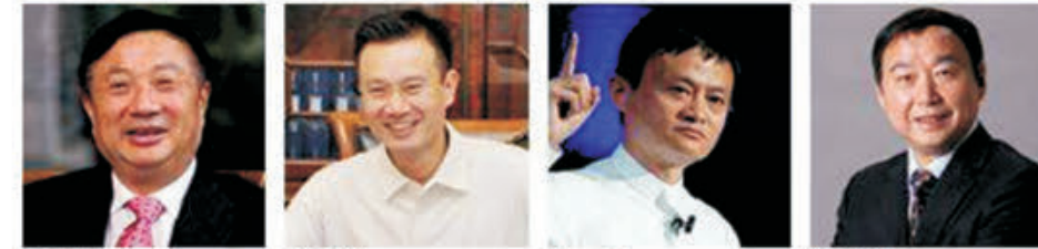
任正非 华为技术有限公司 创始人、总裁 叶简明 中国华信能源 董事局主席 马云 阿里巴巴集团 董事局主席 闫冰竹 北京银行 党委书记、董事长